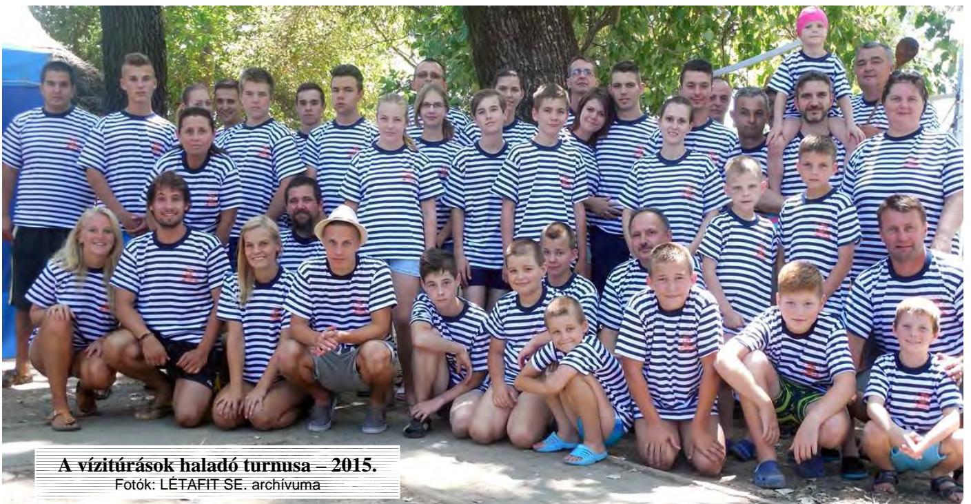
A vízitúrák haladó turnusa – 2015.