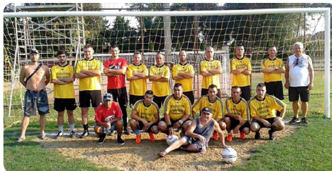
Megye II. felnőtt labdarúgó csapat

Elkészült az őszi labdarúgó menetrendje. Létavértes a szezon nyitómérkőzését Fülöpön játssa.