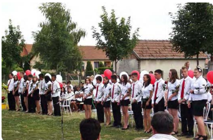
A búcsúzás pillanatai a tanévzáró ünnepségen