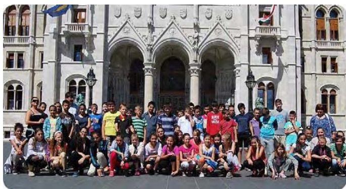
Testvériskolánk tanulóival a megújult Kossuth téren

A testvériskolai pályázat keretében 30 diákunk és az őt kísérő pedagógusok tartalmas 5 napos kiránduláson vettek részt. Cél: Budapest és a Duna-kanyar volt.