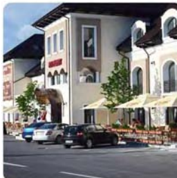
A Hanul Domnes Hotel

Június 6-án reggel öt órakor indultunk 45-fős csoporttal Létavértes-Nagyvárad- Királyhágó- Medgyes- Segesvár- Brassó útvonalon.