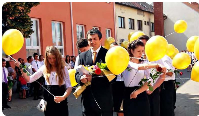
A ballagó 8. c. osztály