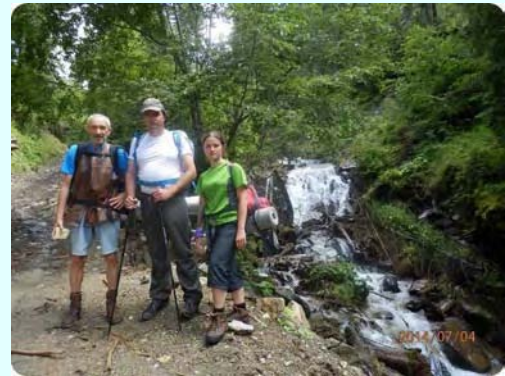
Az északi expedíció tagjai

A magashegyi gerinctúra egyik, semmivel sem összehasonlítható sajátos (napsütéses időben) a folyamatos látványban rejlik.