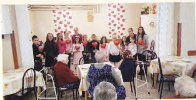
Anyák napi köszöntő