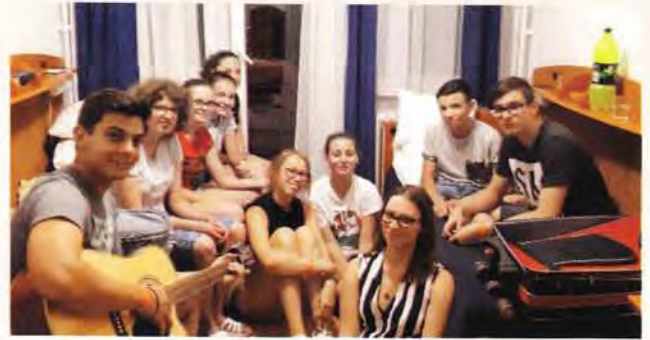
Berekfürdő, gyülekezeti hét