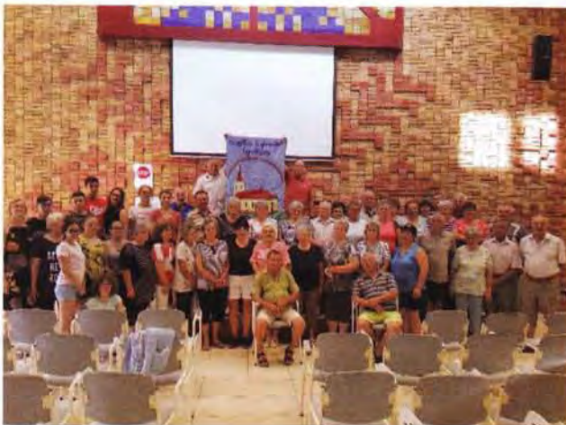
Berekfürdő, gyülekezeti hét