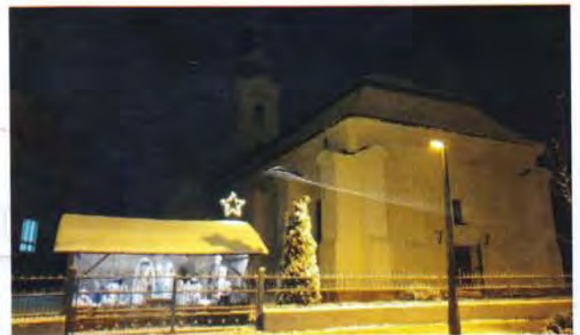
10 éves a „Betlehemünk”