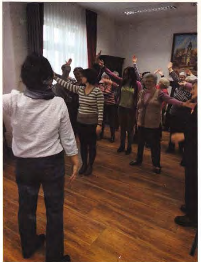
Klubos közös torna