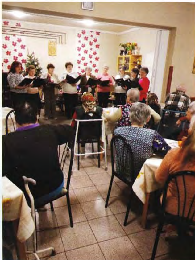
Karácsonyi köszöntő (2018)