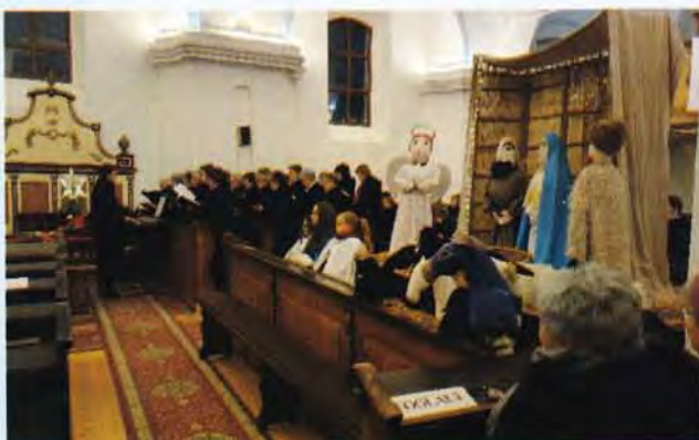
Adventi zenés áhítat