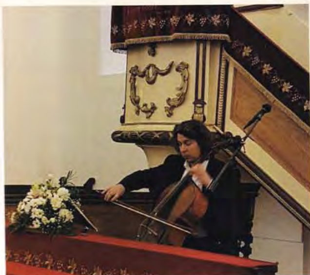
Bach mindenkinek fesztivál