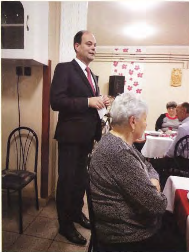
Klubos idősek napja