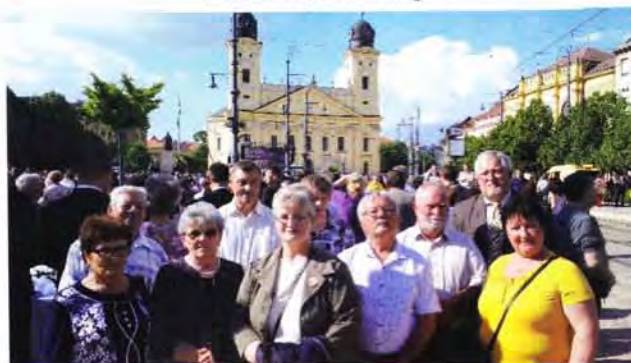
Egységnap ünnepség, 2019. május 22.