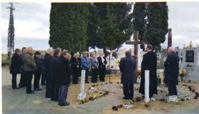
Halottak napi megemlékezés