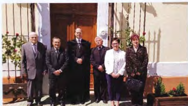
2019-ben a 25 éve konfirmáltak