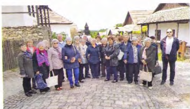
Klubos kirándulás - Hollókő