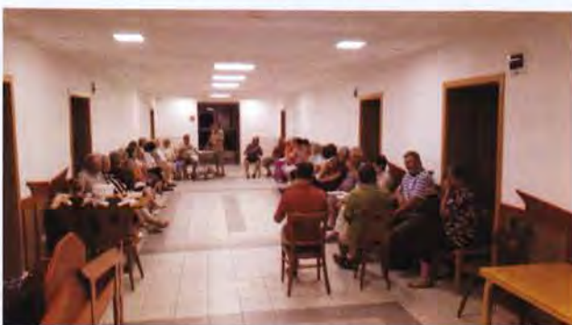
Berekfürdő, gyülekezeti hét