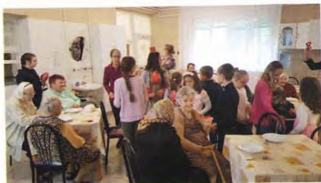
Anyák napi köszöntő