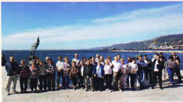
Presbiteri kirándulás, Trieszt