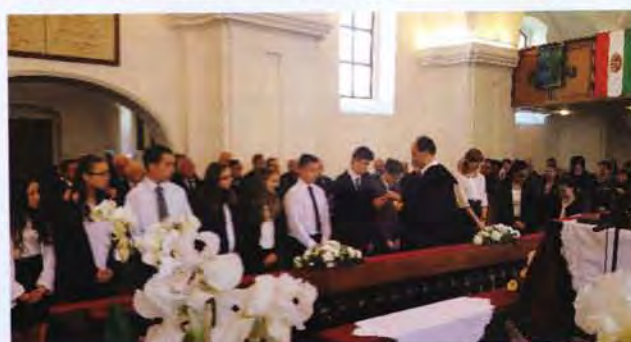
Konfirmandusok első úrvacsoravétele