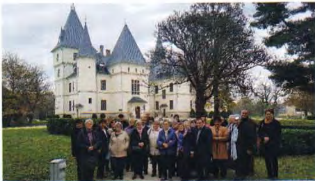
Klubos kirándulás - Tiszadob