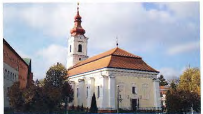
Templomunk az őszi napsütésben