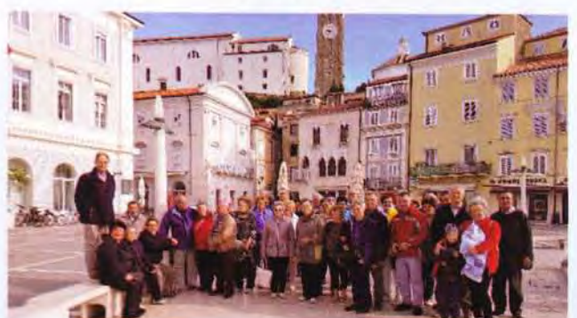
Presbiteri kirándulás, Szlovénia - Piran