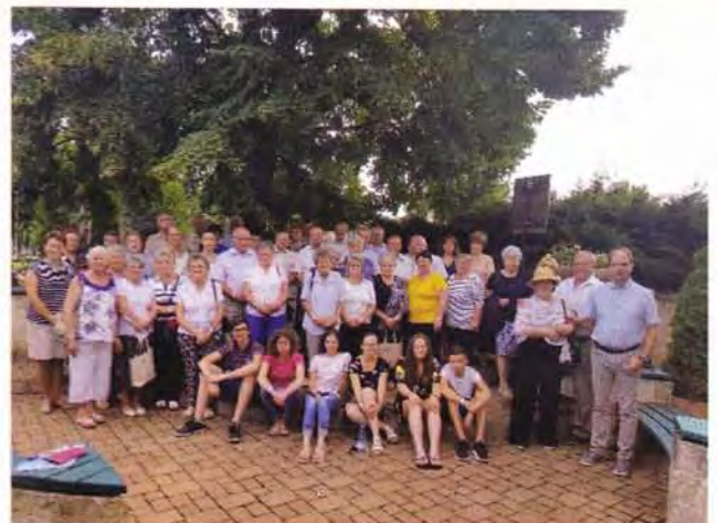
Berekfürdő, gyülekezeti hét