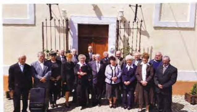
2019-ben az 50 éve konfirmáltak