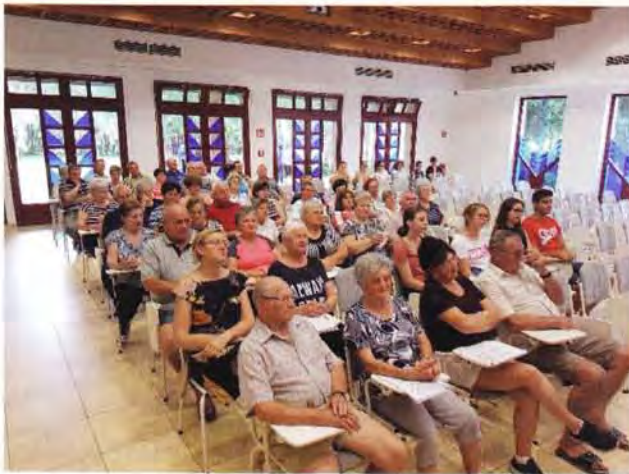
Berekfürdő, gyülekezeti hét